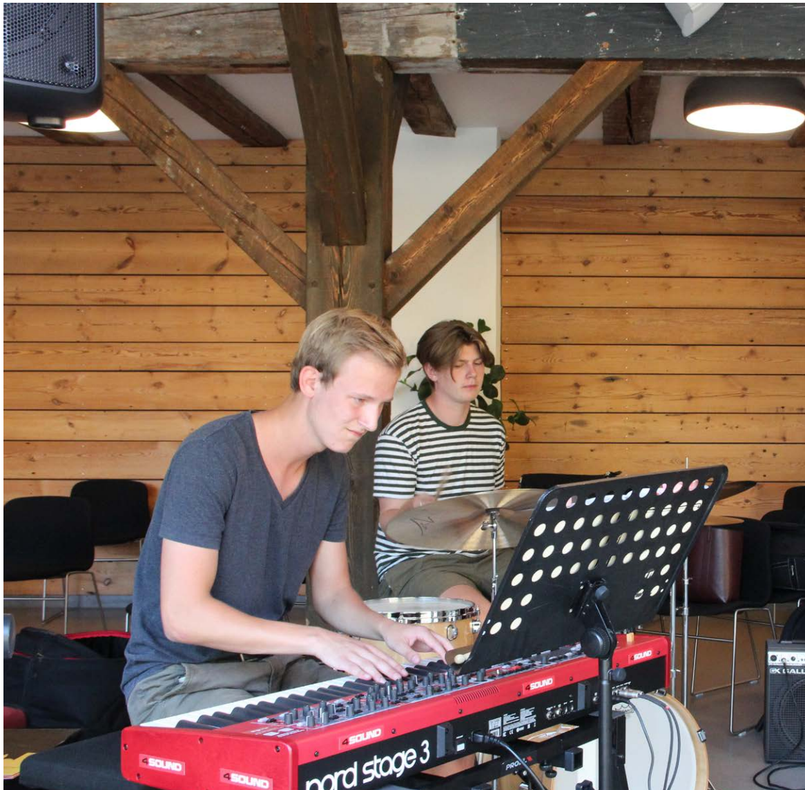
Jazzkvartetten Four spillede, mens netværket diskuterede coronasituationen og nød en forfriskning i aftenstunden.