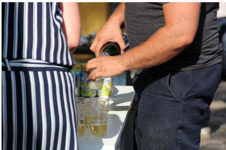
Efter debatten åbnede netværksbaren med snacks og lidt at drikke.