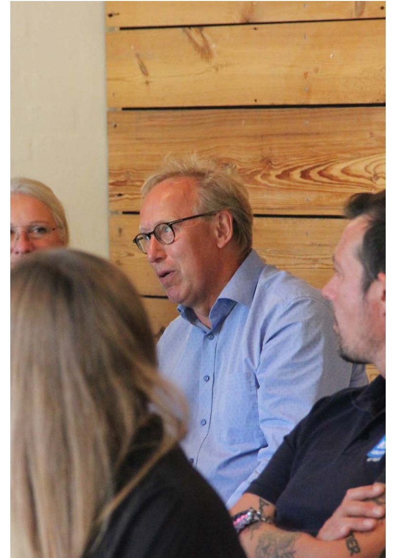
Deltagerne fra Byens Netværk stillede løbende spørgsmål og delte synspunkter.